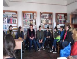
Clubul de lectură "Hoții de cărți"